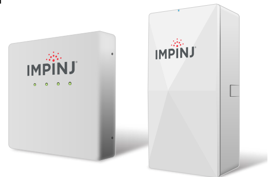
Das Impinj xArray und xSpan.

Hinweis: Impinj xArray befindet sich im End-of-Life-Prozess.